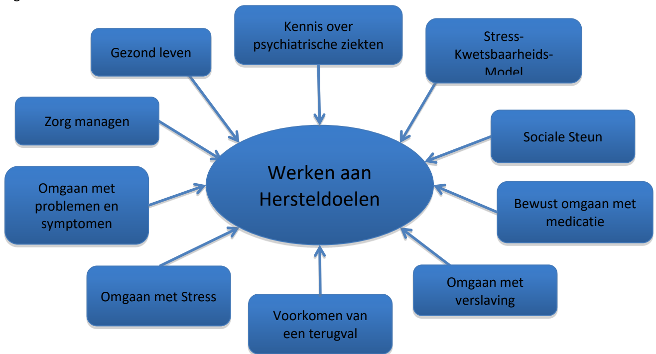
Figuur 1. Een overzicht van de IMR-werkboeken.

De start is altijd met werkboek 1: het formuleren van persoonlijke doelen. Dit vormt de basis voor de overige onderdelen van de training. De geformuleerde doelen op uiteenlopende levenssterreinen zullen gedurende de rest van de training centraal staan. De vervolgwerkboeken gaan stap voor stap in op kennis en vaardigheden gericht op het leren omgaan met obstakels die het bereiken van het persoonlijke doel bemoeilijken. Met behulp van de tien vervolgwerkboeken wordt inzicht verworven in de ziekte en leert men effectief omgaan met de psychiatrische klachten. Gedurende de training kan de cliënt de kracht en mogelijkheden ontdekken om persoonlijke hersteldoel(en) te bereiken en een gevoel van identiteit op te bouwen, waardoor het mogelijk is boven de ziekte uit te groeien. Uniek aan IMR is de combinatie van het werken aan klinisch herstel in de vorm van het verkleinen