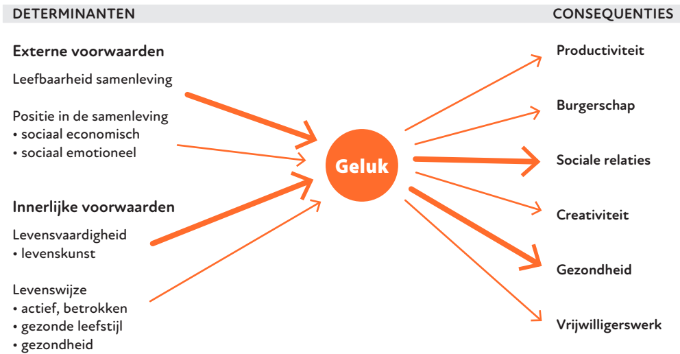
FIGUUR 7.1 Determinanten en consequenties van geluk

voor te herhalen, maar van groot belang is dat een dergelijk cijfer voor voldoening voorspellende waarde heeft. Mensen die gelukkig zijn, leven bijvoorbeeld een stuk langer dan mensen die ongelukkig zijn. Dit verschil is even groot als tussen wel of niet roken.