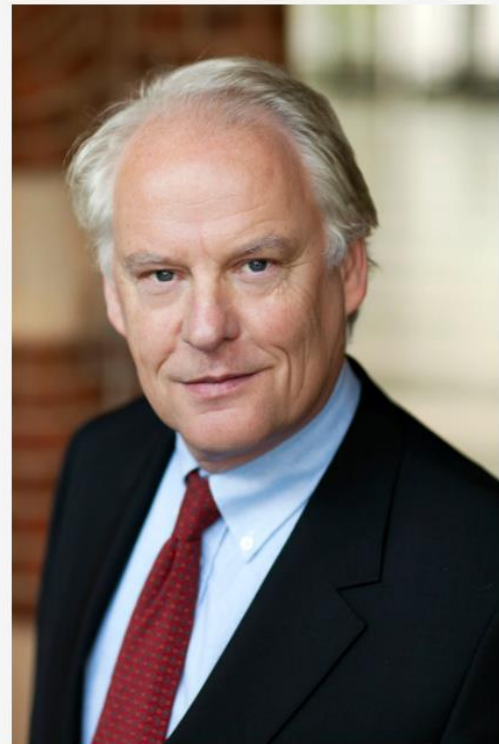
Sweder van Wijnbergen Emeritus hoogleraar economie aan de Universiteit van Amsterdam

Daarnaast is de uitrol van vaccinatieprogramma's natuurlijk van doorslaggevend belang. Er is nu een aantal effectieve vaccins, maar mondiaal krijgen regeringen te maken met de uitdagingen van vaccinatieprogramma's op een ongeziene schaal. Van Wijnbergen: 'In Nederland moeten we nog zien hoe dat uitpakt. Het is de vraag of minister De Jonge in staat is om hier goed beleid op te maken. Daarbij moet ik aantekenen dat het economische beleid van de regering, de corona-steunpakketten, goed zijn en effectief faillissementen en ontslagen voorkomt.'